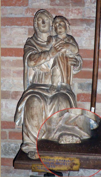
Madonna Sec. XVIII