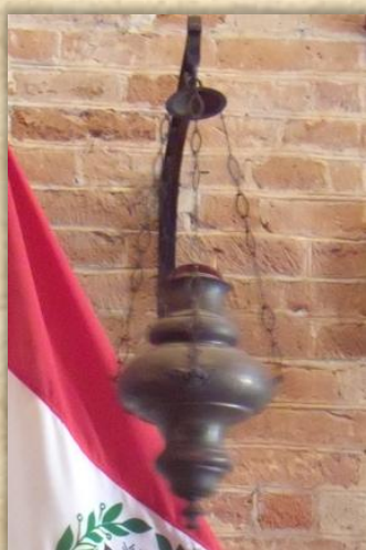
Lampada del Santissimo

La lampada del Santissimo, nonché i candelieri, lo stesso turibolo, la campanella d'inizio funzioni, le 14 formelle della Via Crucis di metallo fuso, appaiono in discutibile stato di pulizia e manutenzione.