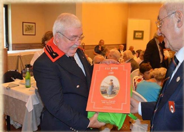
Il Presidente della Sezione ANAC di Lodi ha un dono per tutti i partecipanti. Qui mentre lo porge al Priore del Tempio.