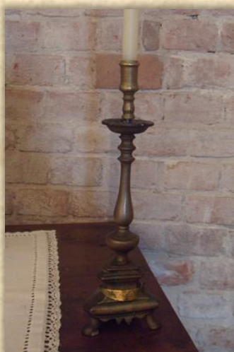
uno dei candelieri