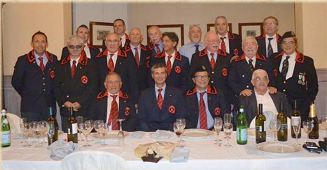
Alcune delle "vecchie sciabole di Lodi" che hanno partecipato al Raduno