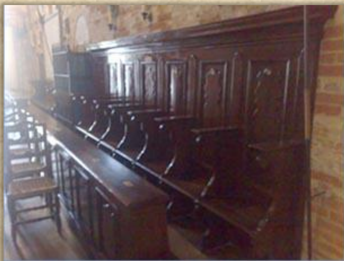
Scranni del sec. XVII - Dono di S.M. Umberto I

All'interno la severità romanica è temperata dai colori degli stemmi della Cavalleria italiana, cui si aggiungono le pietre che ricordano i cavalieri decorati con le massime ricompense (O.M.S. e M.O.), nonché altre minori.