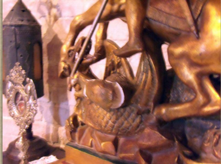
San Giorgio, particolare della rottura

A fattor comune, tutto l'arredo in legno, così come le opere d'arte dello stesso materiale, sono intaccate dai tarli, la cui attività è testimoniata dalla sottile fine segatura rilasciata sul pavimento.